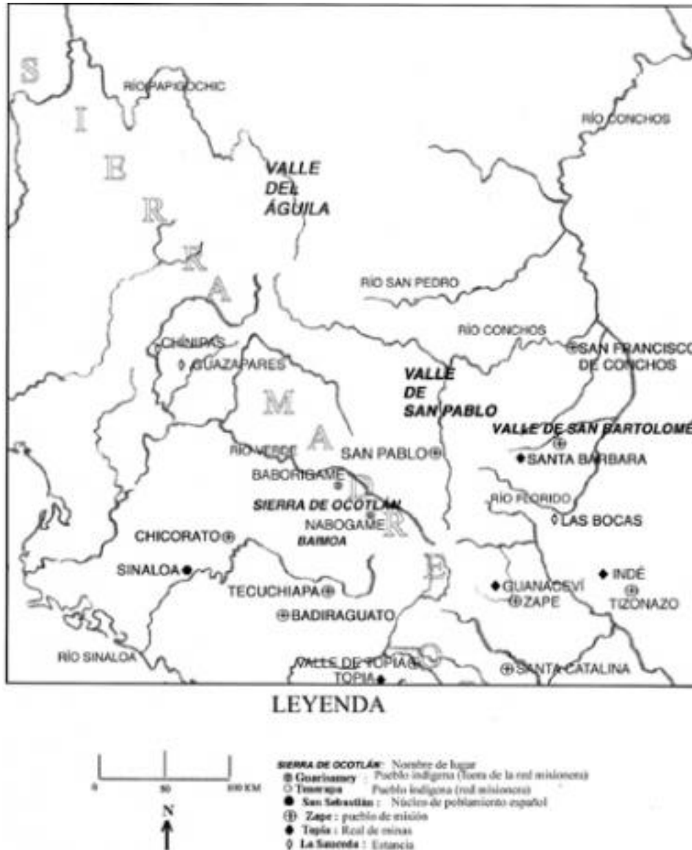
Figura 2 :La Nueva Vizcaya a principios del siglo XVII (detalle : el norte)