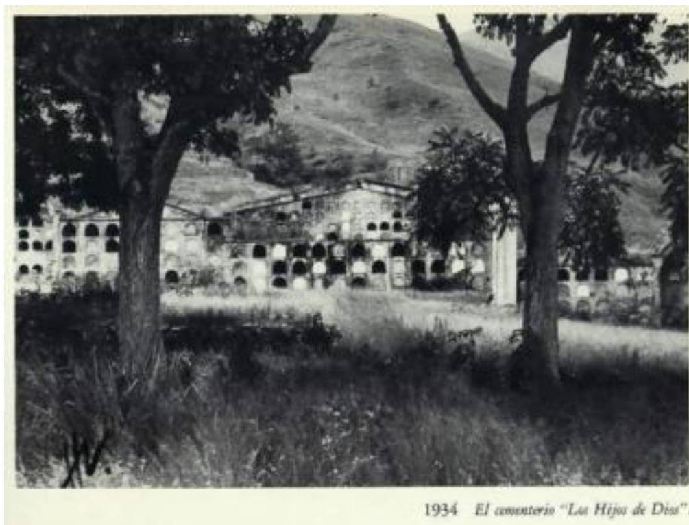
Figura 4: Cementerio Los Hijos de Dios, 1934.