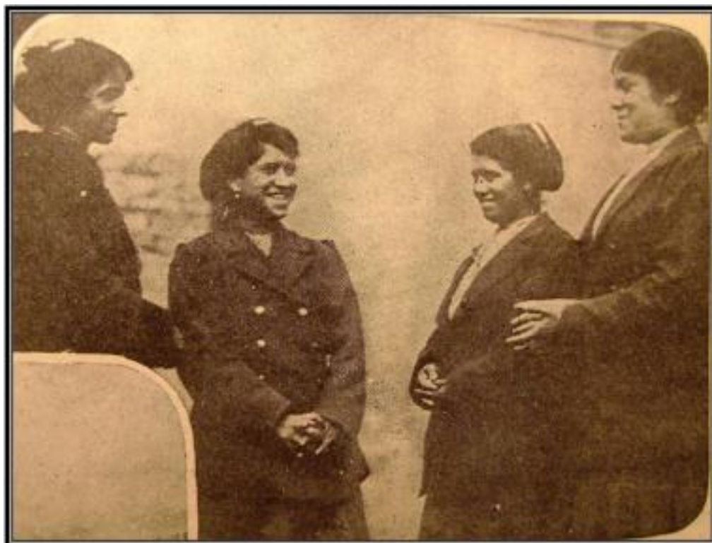
Imagen 4. “La huelga de empleados de tranvía”, Zig-Zag , 369, 16.3.1912