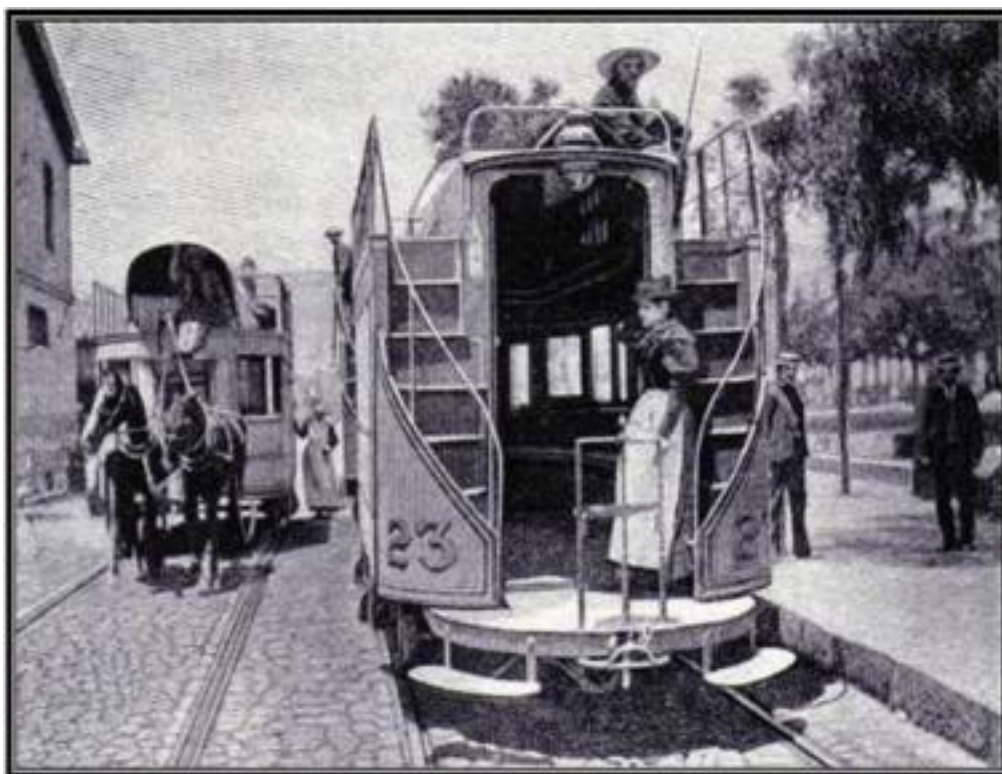
Imagen 1. “Conductora de Tranvía Urbano”, Frank Carpenter, South America, 1899