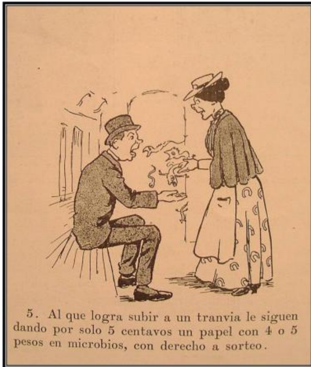
Imagen 3. “A través de Santiago”, Zig Zag , 63, 24.4.1906